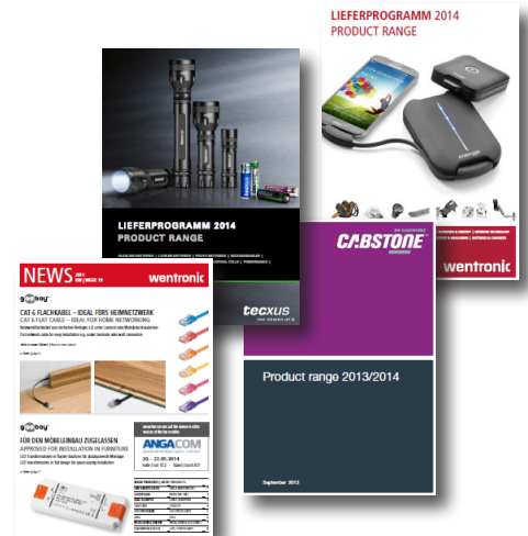
Produktinformationen für Markenkataloge werden ausschließlich im Perfon PIM-System gepflegt

Als Händler und Hersteller produziert Wentronic für seine Eigenmarken diverse Handelsmedien. Diese Print- und Digitalmedien werden seit 2015 vom Perfon PIM-System mit Daten "gefüttert":